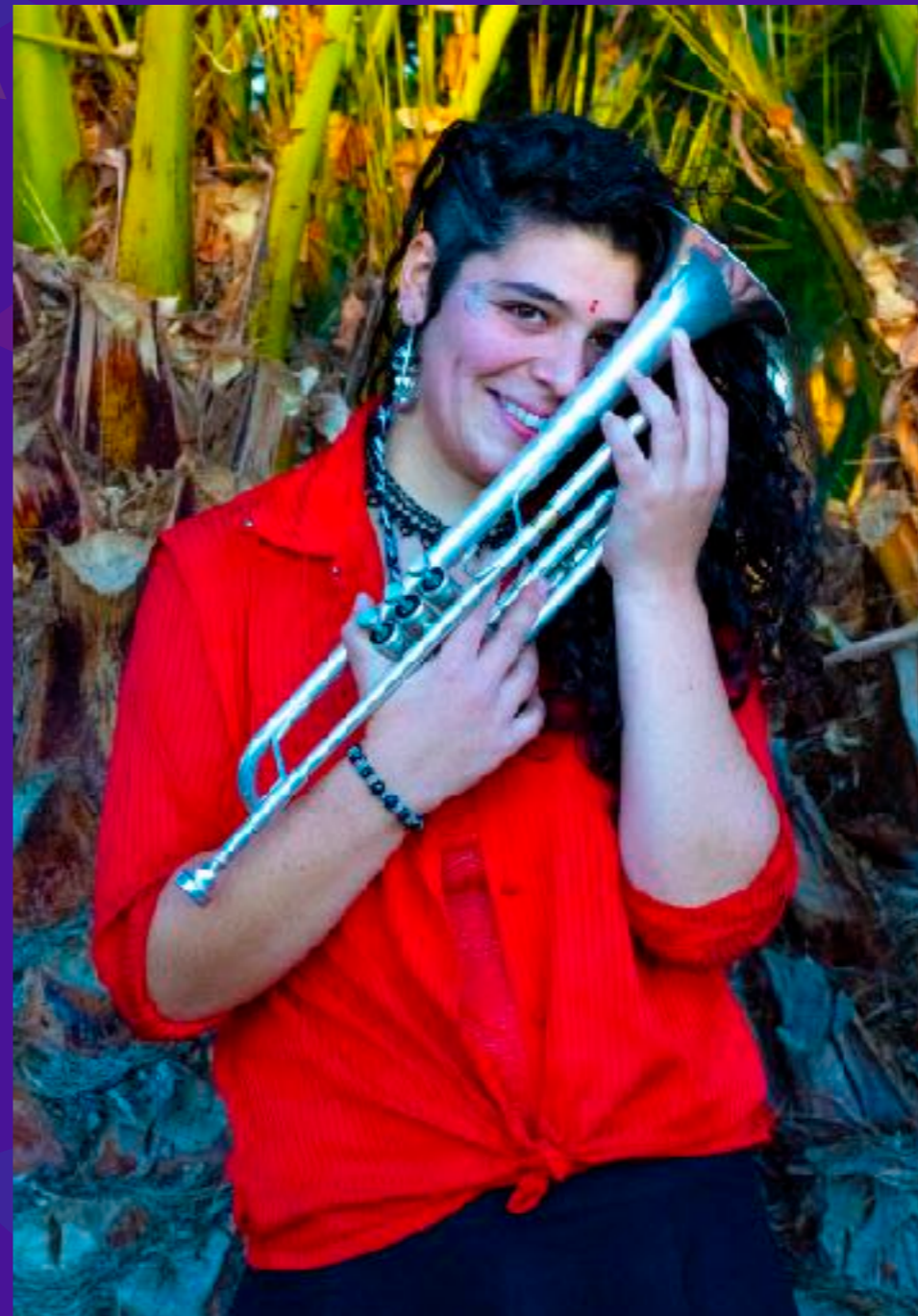
Rake MP Trompetista