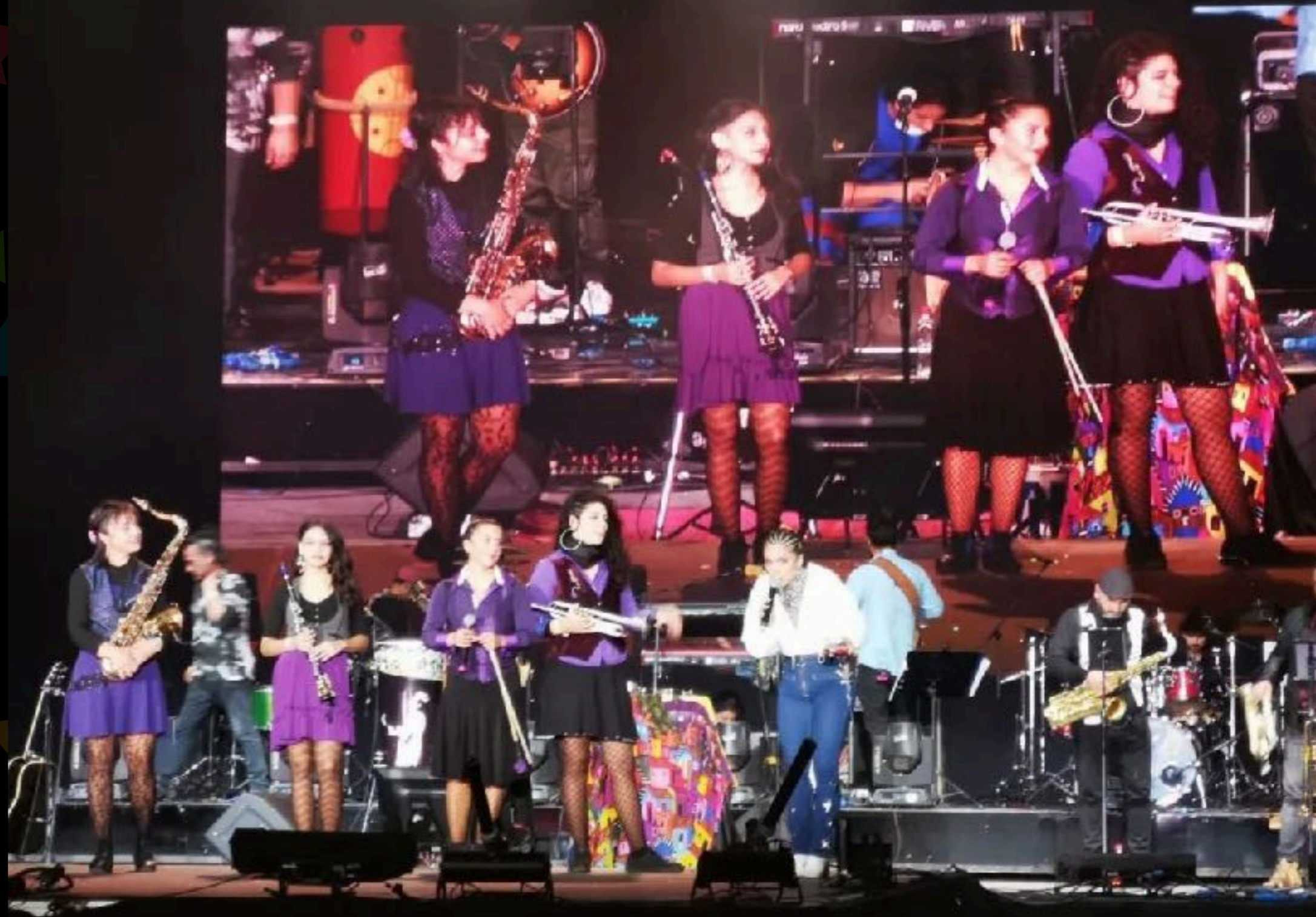
Quinta Vergara, Viña del Mar, Chile 2022